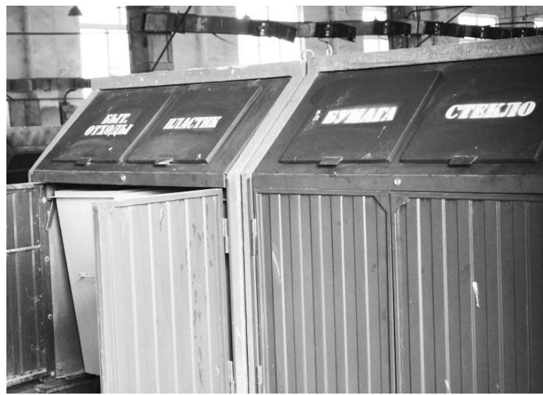
Контейнер для раздельного сбора мусора (ООО «Стеклопласт»)