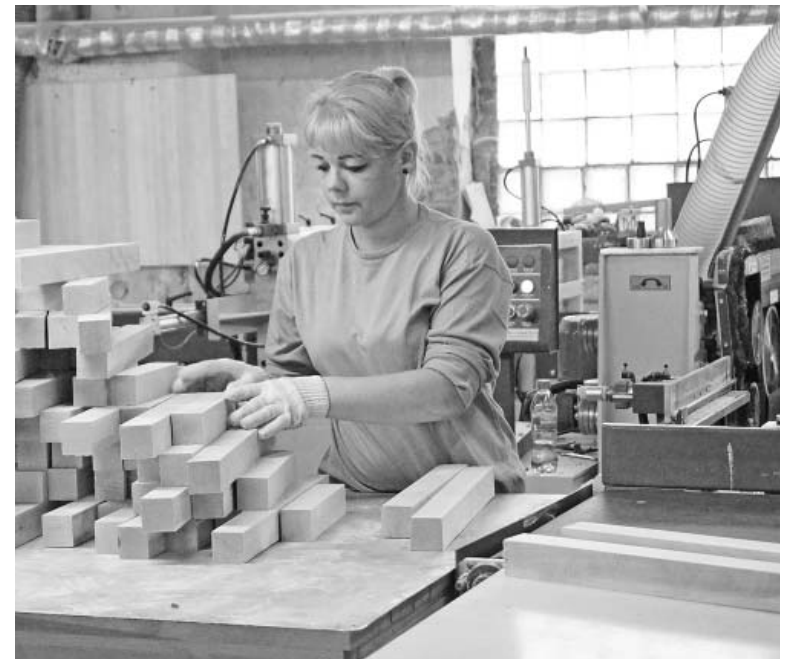
В производственных цехах ООО «Лесной союз».